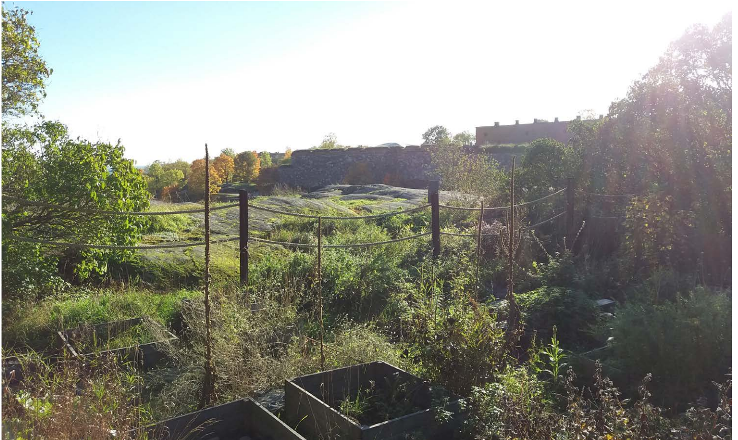
Asukkaiden viljelypalsta vanhan vuonna 1918 toimineen vankileirin paikalla.

Kevätretki Suomenlinnan rakennettu ja istutettu maisema järjestetään keskiviikkona 18.5.2022 .