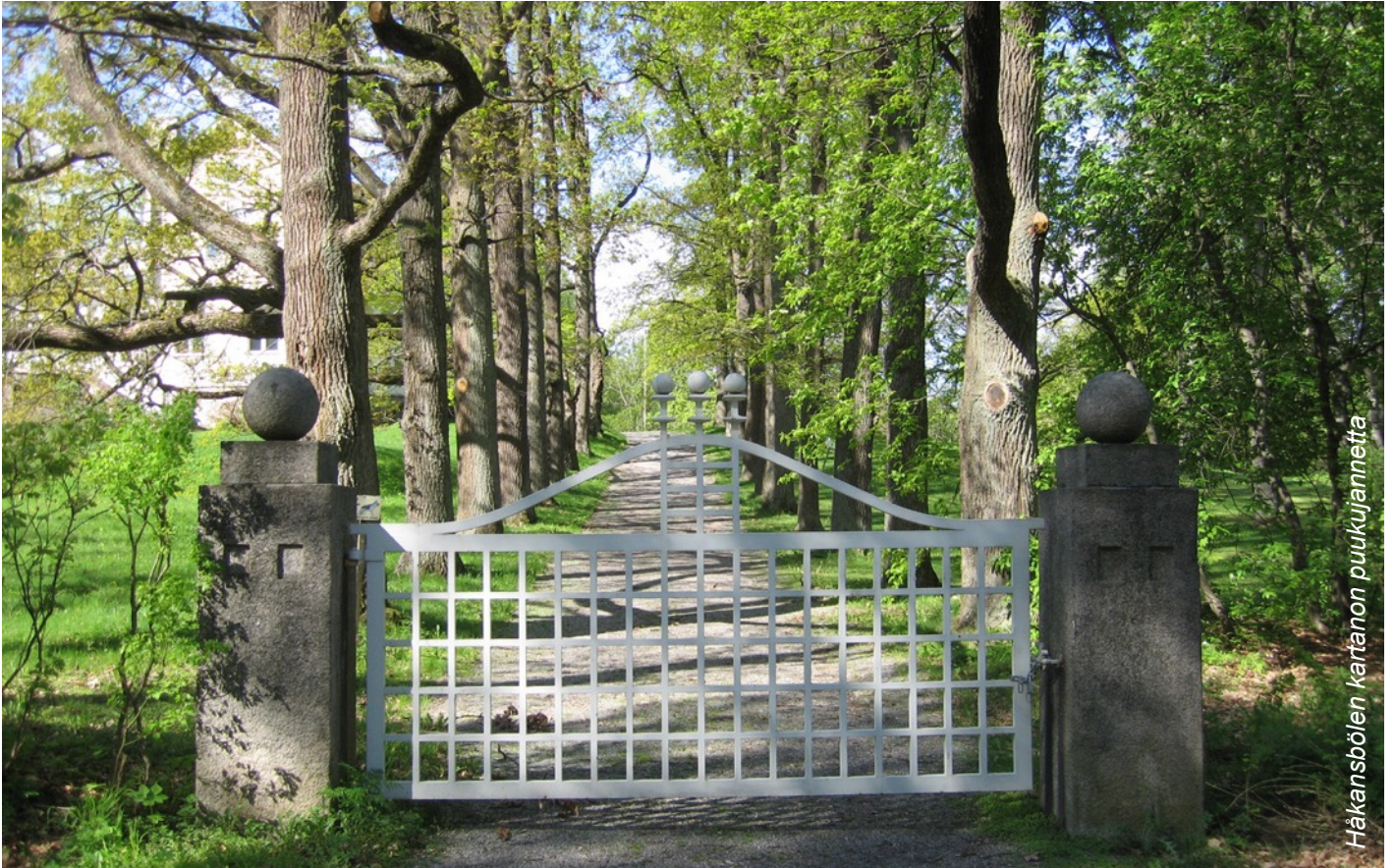
Håkansbölen kartanon puukujannetta

Opastettu puistokävely 31.5.2016 klo 18.00-20.00