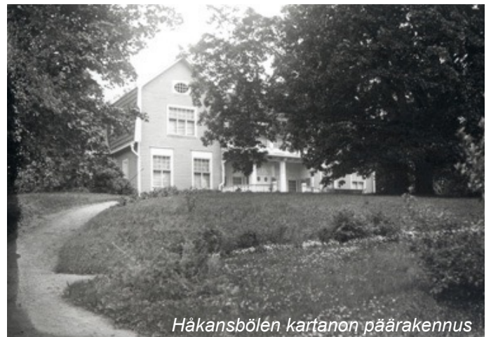
Håkansbölen kartanon päärakennus

Munsterhjelmien aikana rakennettiin uusi päärakennus 1844 ja 1800-luvun puolivälissä kartanopuistoa laajennettiin rakentamalla uusia puistokäytäviä ja nurmینیittyjä puu- ja pensasistutuksineen sekä istuttamalla olemassa oleva tammikujanne. Myös viljelytoimintaa kehitettiin. 1800-luvulla rakennettiin Kormuniitynojaan liittyvä tekosaari, Kaffeholmen, jonne kuljettiin koristeellista, valkoista puusiltaa pitkin. Munsterhjelmien aikana 1838-1879 tilan pinta-ala laajeni noin 900 hehtaariin.