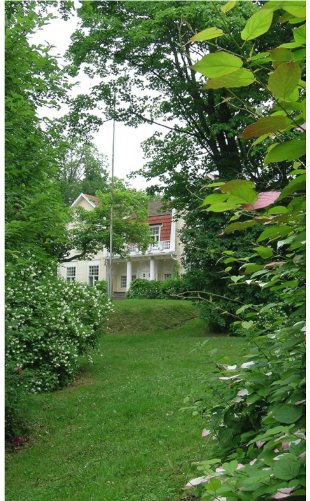
Häkansbölen kartano.