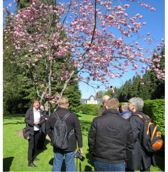
Norrviikenin puutarhaa. Kuvat: Gretel Hemgård ja Mona Schalin

Oppaiden johdolla saimme tietoa Abelinin ajatuksista ja visioista ihaillessamme näkyviä renessanssipuutarhan porrastuksiin ja vesiaiheeseen, luostari- ja japanilaispuutarhan tilanjakoon, barokkipuutarhan muotokieleeseen sekä alempana rinteessä japanilaiseen puutarhatunnelmaan. Kaikesta olimme vaikuttuneita ja jaamme oppaiden huolen Norrvikenin tulevaisuudesta, kun hoitokustannuksia joudutaan entisestään kutistamaan.