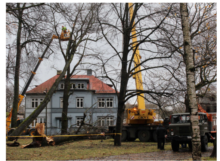
Syysmyrskyn tuhojen korjuu käynnissä Vanapargissa 29.10.2013. Puisto on suojeltu, puut ovat vanhoja, mutta luonto on armoton.