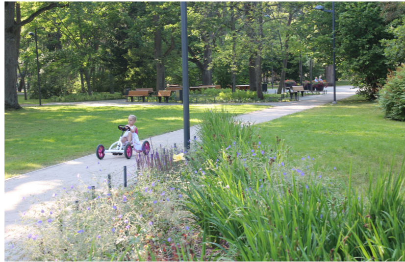
Rannaparkin uudistettu osa tarjoaa elämyksiä kaikille.