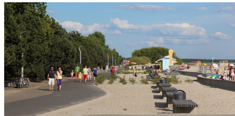
Rannapromenaad kauniina kesäpäivänä.

Vuonna 2013 juhlittiin 175-vuotista kylpylätoimintaa. Juhlavuoden logona ja myös ihan oikeana hahmona esiintyi norsu, jonka synnystä on monta tarinaa. Kaksi puista liukumäkenä toimivaa norsua oli rannassa lapsia puoleensa vetämässä. Norsut olivat rekonstruktioita jo varhaisemalla kylpyläajalla olleista liukumäkinorsuista.