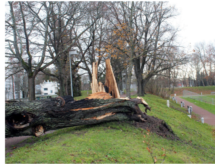
Syysmyrsky 29.10.2013 jätti jälkensä Vallikäärin puustoon. Tuulen nopeus 31 m/s oli liikaa vanhalle lehmukselle