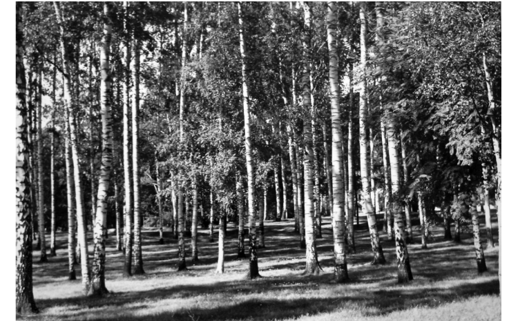
Sibeliuksen puiston koivikko 28.7.1979

Puistojen kasvillisuuden monimuotoisuus ja tilarakenteen selkeys ovat vähentyneet ajan saatossa. Koska laajat osat puistoista rakennettiin lyhyen ajan sisällä, kasvillisuus on tasa-ikäistä. Puiden elinaika on vähitellen päättymässä ja toimenpiteitä vaaditaan pian, jotta vältetään laajojen puuttomien alueiden syntymiseltä. Tarpeelliset uudistamistyöt tulevat varmasti herättämään keskustelua. Kunnostustyön lähtökohtana tulisi pitää puistojen historiaa, arvoja ja ominaispiirteitä.