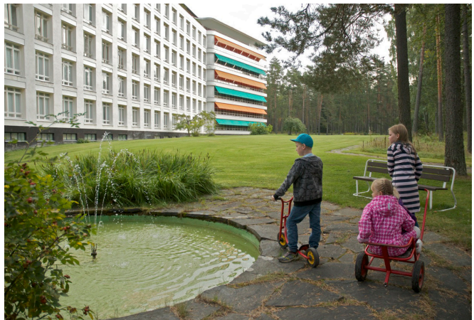
Lapsia Paimion pihaympäristössä vuonna 2014.

Tuberkuloosiin tehoavien lääkkeiden löytymisen myötä auringonvalon ja ympäristön merkitys vähentyi. Muun muassa päärakennuksen eteläpuoleinen käytäväsomitelma muutettiin nurmeksi ja suurin osa suihkulähteistä poistettiin. Viidestä suihkulähteestä on nykyään toiminnassa enää yksi. Muiden neljän suihkulähteen pohjat ovat kuitenkin säilyneet nurmikolla.