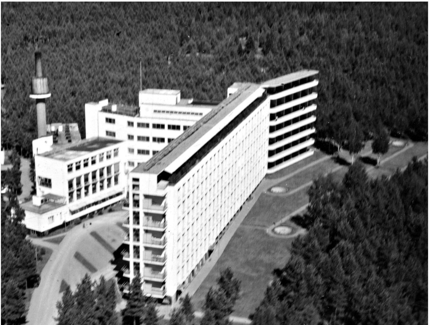
Viistoilmakuva 1930-luvun lopulta.

Yksi esimerkki ympäristön hyödyntämisestä on Aallon kilpailuehdotuksessa hallisiiven eteen suunniteltu pihan terassointi, jossa makaavien tuberkuloosipotilaiden ajateltiin hyötyvän auringonvalosta ja mäntymetsän ilmastasta. Terassointi ei kuitenkaan toteutunut sellaisenaan vaan varojen puutteesta johtuen Aallon toimistossa laadittiin uusi suunnitelma päärakennuksen eteläpuoleisesta piha-alueesta. Toteutunut sommitelma perustui serpentiinikäytävään ja suihkulähteisiin sekä avoimeen tilaan, jota päärakennuksen lisäksi rajasi mäntymetsä. Käytävällä oli mahdollista ulkoilla ja suihkulähteiden solina kantautui potilashuoneiden ikkunoista sängyssä makaaville potilaille.