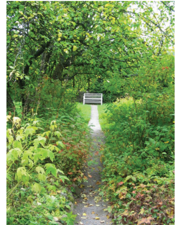
Ainola, syyskuu 2010 (MS)

On aika löytää sopiva muoto toiminnan vakiinnuttamiseksi ja rahoittamiseksi. Yksittäisten projektiaavustusten rinnalla korkeatasoisten julkaisujen, tutkimushank-